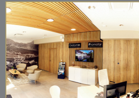
Espace de vente