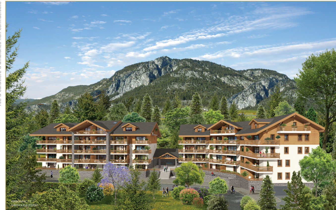
Vue à caractère d'ambiance non contractuelle