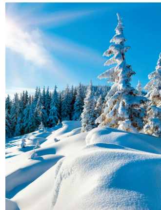
Domaine de Serre Chevalier