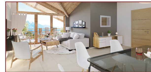
Vue à caractère d'ambiance non contractuelle