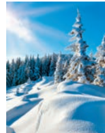
Domaine de Serre Chevalier